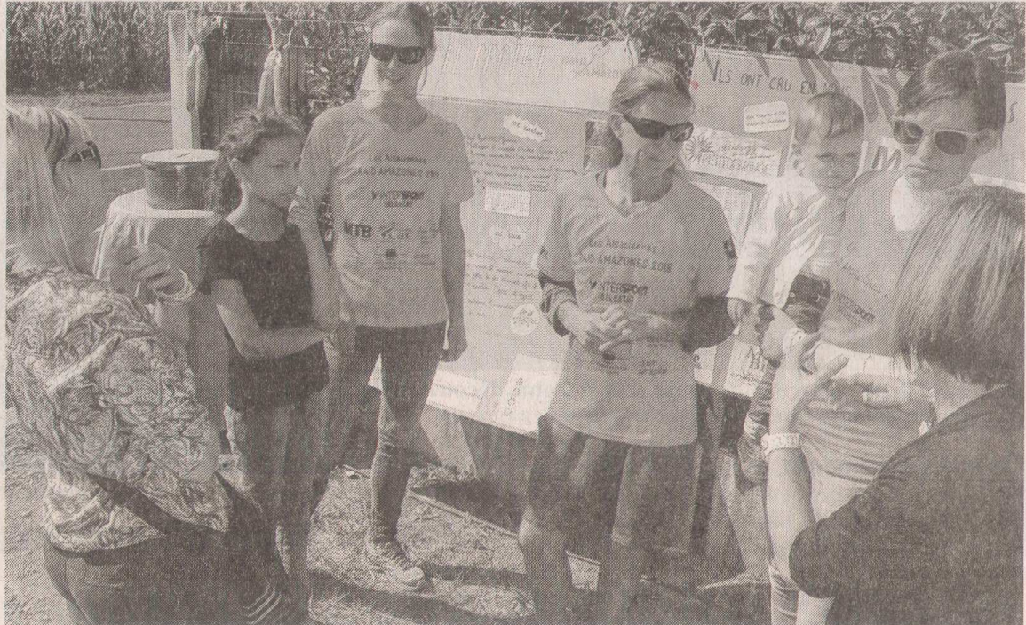
Une centaine de personnes sont venues s'informer sur le Raid et la mucoviscidose.